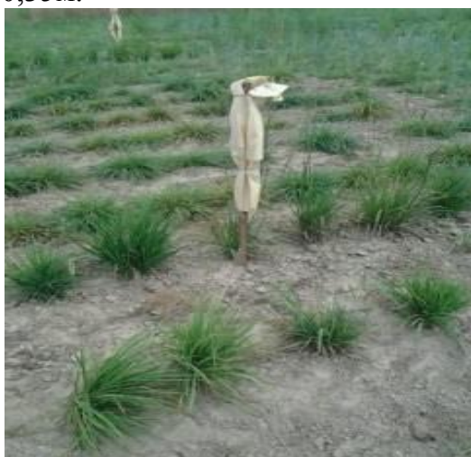
Рисунок 1– Изоляция растений лисохвоста лугового в полевых условиях

Для преодоления про– и постгамной несовместимости нами было культивировано на питательную среду более 300 зародышей межвидового гибрида лисохвоста лугового. Специально подобранный состав компонентов питательных сред для культивирования незрелых зародышей предоставляет все необходимые вещества для развития зародыша и, таким образом, заменяет эндосперм. При отдаленной гибридизации в результате рекомбинации генов происходит интенсивный формообразовательный процесс. Это позволяет ускорить отбор перспективных форм, объединяющих геномы в гибридах лисохвоста. Жизнеспособные растения лисохвоста лугового, полученные в результате проведенных биотехнологических работ высаживали в почвенные условия ФТК. Рассада выращивается с проведением подкосов по мере нарастания биомассы при наступлении фазы кущения. Хорошо раскутившиеся растения в условиях ФТК, прошедшие яровизацию, высаживали в полевые условия, в рядки с междурядьем 0,7 м х 0,35 м.