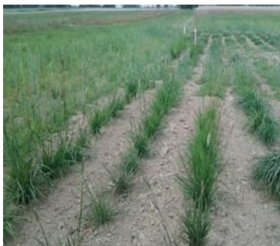
Рисунок 2 – Индивидуальное размещение лисохвоста лугового (0,7 м X 0,35 м)