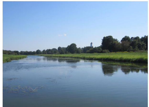
Рисунок 3 – Популяции золотарника в прибрежной зоне поймы реки Свислочь

Заключение. Заброшенные и отчуждённые из хозяйственной деятельности территории, являются своего рода резерватом и потенциальным "рассадником" инвазионных видов. Опыт различных стран мира (Германия, Канада, КНР, США) показывает, что только целенаправленное сдерживание инвазии, а наряду с этим, и целевое вовлечение в хозяйственный оборот отчужденных территорий, является реальной возможностью остановить дальнейшую экспансию чужеродных видов.