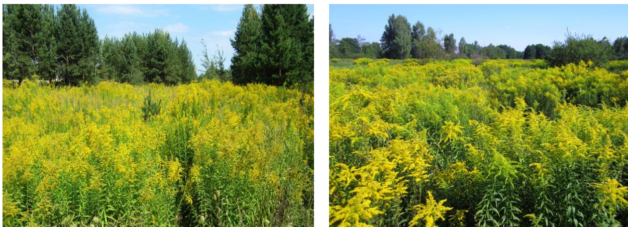
Рисунок 1 – Золотарник канадский на опушке леса и в пойме реки (Минская обл.)

Как отмечалось, в Беларуси наибольшую экологическую угрозу для многолетних растительных популяций представляет золотарники S. canadensis и S. gigantea – массовое распространение этих чужеродных видов началось с отдельных кладбищ и палисадников в 90-е годы XX-го века [2, 5] и они внесены в «Список инвазионных видов», составленный «ЕРРО» (Европейская и средиземноморская организация по защите растений), в котором перечислены растения, наносящие ущерб аборигенным видам, окружающей среде и биологическому разнообразию. Одним из наиболее опасных инвазионных растений в Европе в настоящее время считается S. canadensis , который способен в короткие сроки вытеснить из популяций большинство полезных местных видов, образуя монодоминантные популяции. В ряде мест жёлтые кустики золотарника, а порой, и целые его заросли стали привычным осенним пейзажем (Рис. 1).