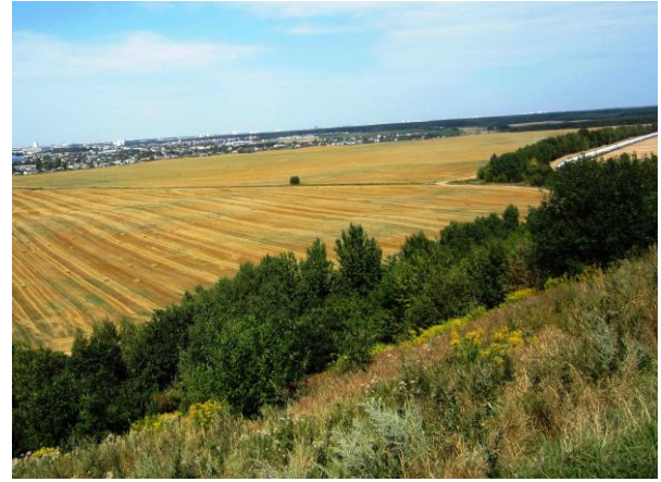
Рисунок 2 – Золотарник на подведомственной территории ЛЭП и на склоне насыпного холма закрытого мусорного полигона (в окрестностях Минска)

Эффективные меры контроля фитоинвазий. В настоящее время борьба с инвазионными растениями, в частности с золотарником, ведётся преимущественно механическим способом (подкашивание, дискование), но этого явно недостаточно, поскольку не учитываются биологические особенности вида (развитая корневая система, высокая плодовитость). Лучшие результаты в уничтожении агрессивных видов достигаются применением гербицидов [2, 4, 5]. Практика показала, что в сдерживании фитоинвазий более рационально применять комплексный системный подход: скашивание до начала бутонизации, а затем обработка гербицидами избирательного действия, плюс последующий посев бобовых и многолетних злаковых трав. Однако, следует учитывать, что использование гербицидов запрещено на землях природоохранного, оздоровительного, рекреационного и историко-культурного назначения, также в границах заказников и памятников природы.